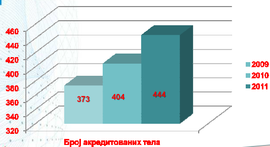
Број акредитованих тела

Број акредитованих тела повећање 19.3% у односу на 2009.