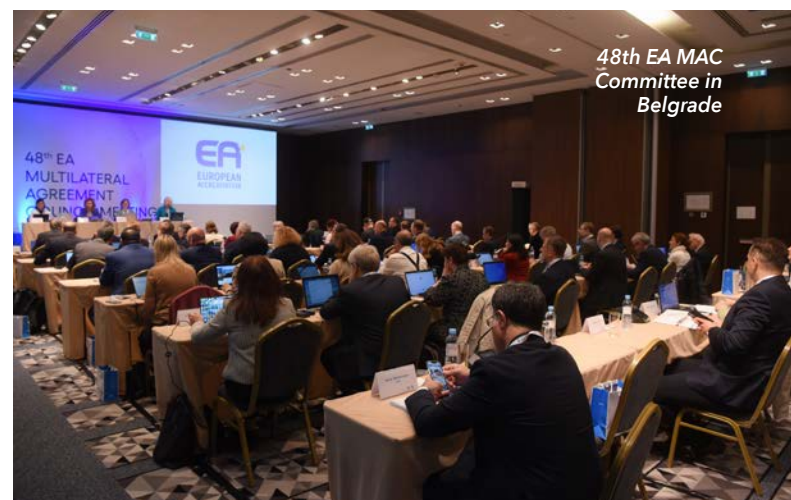
48th EA MAC Committee in Belgrade