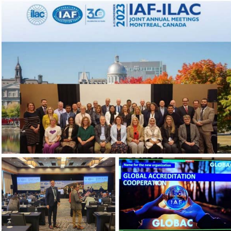
ILAC IAF, Монтреал

Обуке нових чланова представљају кључну иницијативу за развијање неопходних вештина међу потенцијалним оцењивачима.