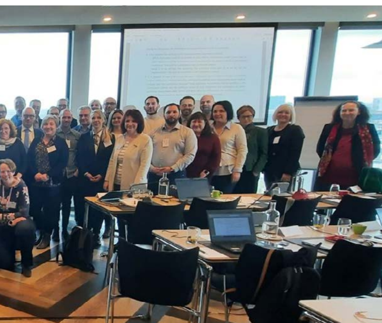
Participants of the EA CC and EA IC Committees in Utrecht

ATS representatives participated in the Horizontal Committee for Harmonization (HHC), namely: at the 29th session that was held in Brussels, Kingdom of Belgium on March 8 and 9, 2023, as well as at the 30th session that was held on the 13th and 14th. September in Paris, where the revision of the document: EA-2/15 (EA requirements for the accreditation of flexible and EA Procedure and Criteria for the Evaluation of CA Schemes by EA NABs) was discussed the most.