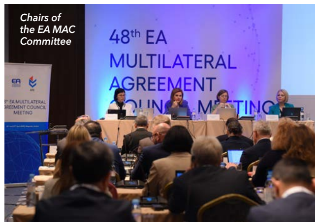
Chairs of the EA MAC Committee