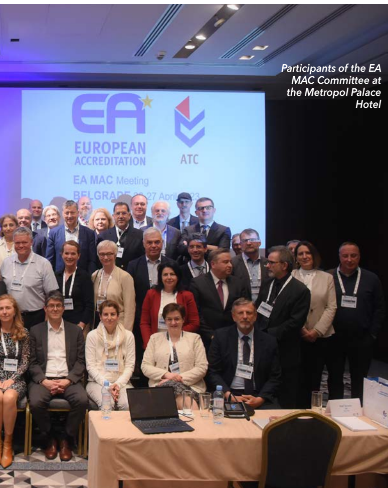
Participants of the EA MAC Committee at the Metropol Palace Hotel

The European co-operation for accreditation (EA)