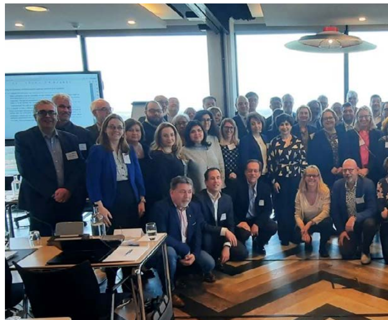
Учесници ЕА СС и ЕА ИС Комитета у Утрехту