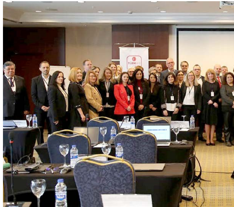
Учесници 45. ЕА ЛС Комитета

Акредитационо тело Србије (АТС) имало је част да буде домаћин 48. Комитета за мултилатералне споразуме Европске организације за акредитацију - EA MULTILATERAL AGREEMENT COUNCIL (MAC) MEETING. Седнице Комитета одржане су