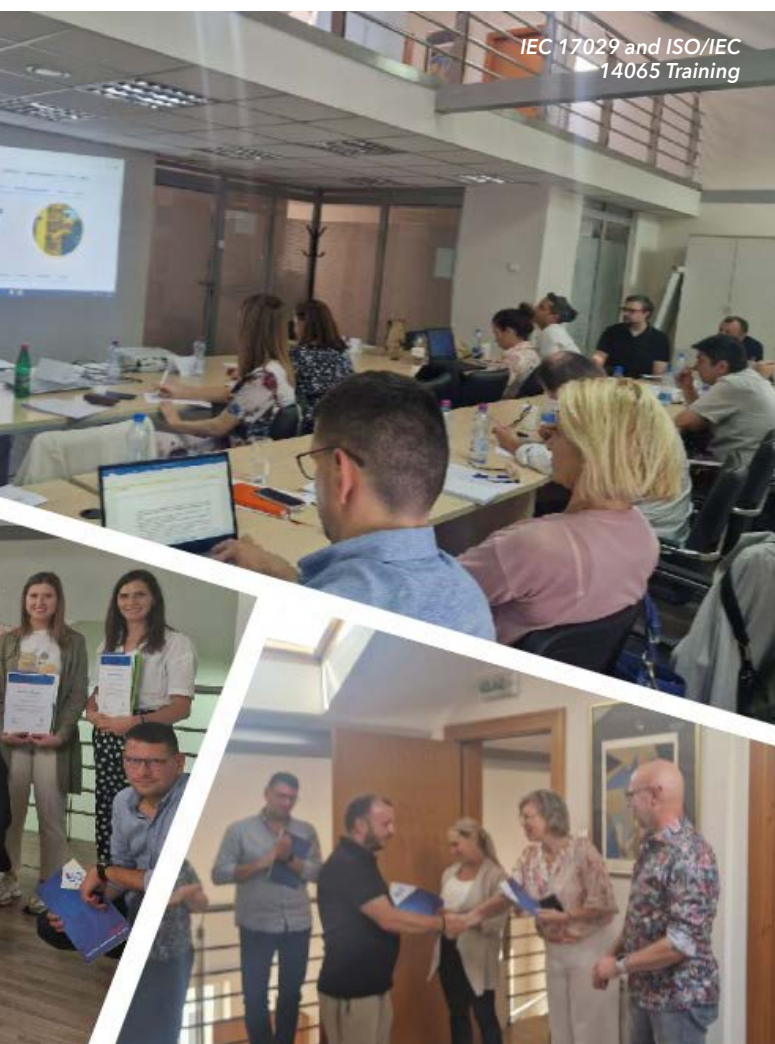
IEC 17029 and ISO/IEC 14065 Training