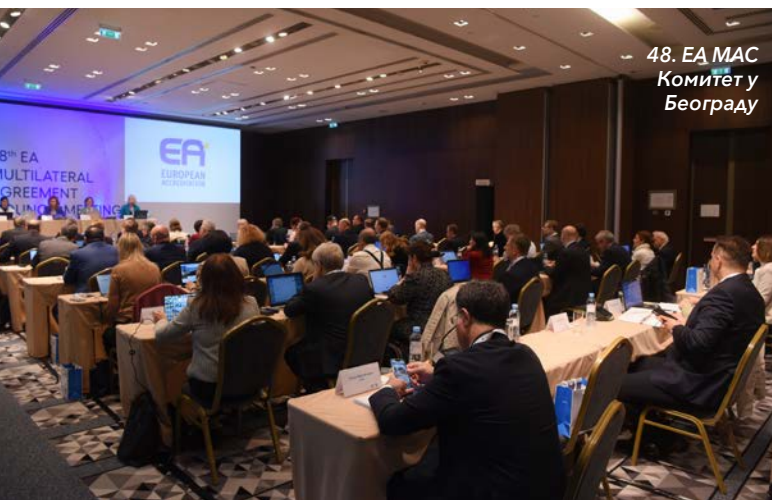
48. ЕА MAC Комитет у Београду