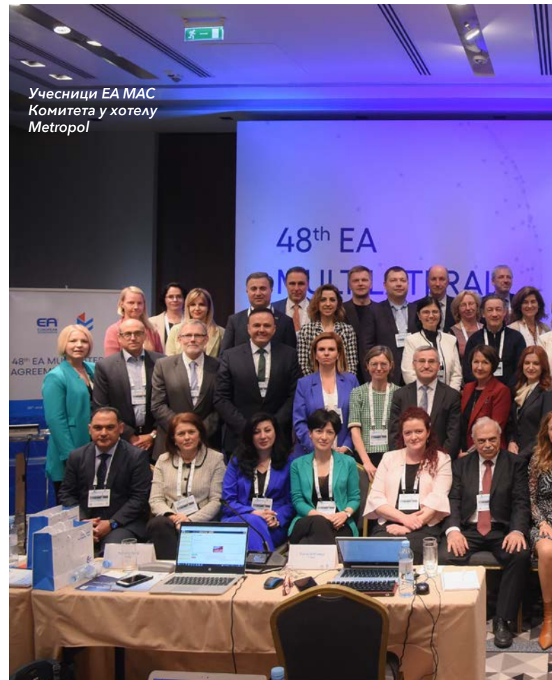
Учесници ЕА MAC Комитета у хотелу Metropal