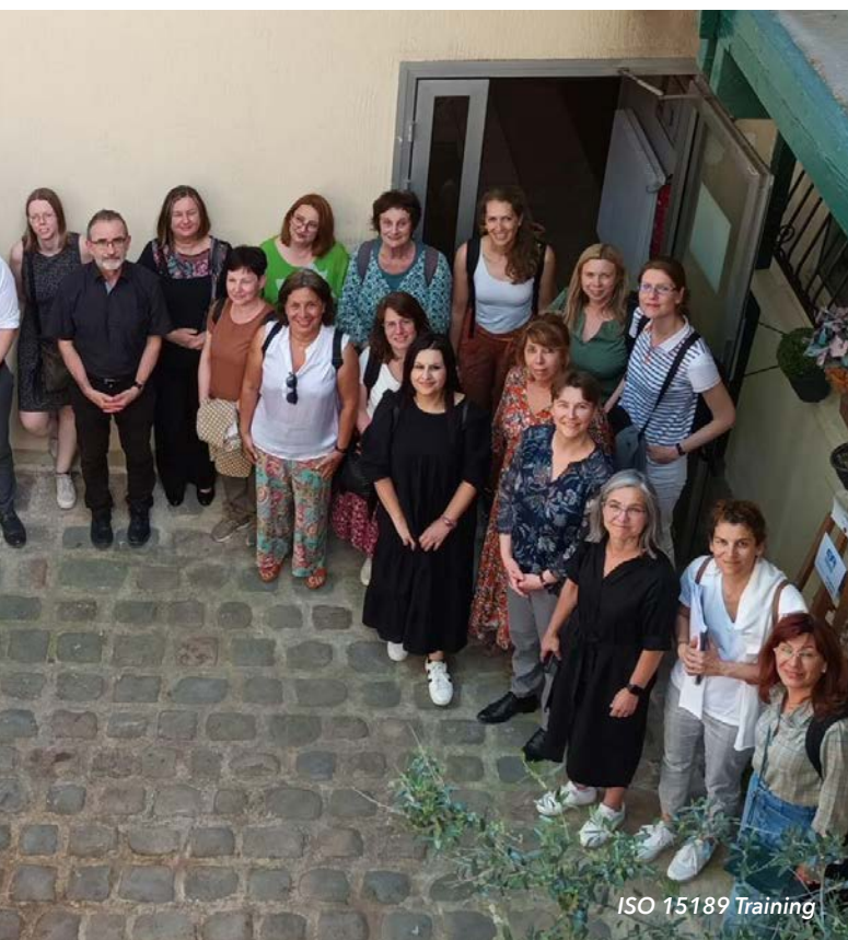
ISO 15189 Training

The goal of the seminar was the improvement of technical skills and competences as well as the exchange of best practices in the field of accreditation of organizations dealing with measurement and reporting of greenhouse gas emissions. Accreditation of validation and verification bodies plays a key role in ensuring the integrity and accuracy of GHG emissions data, which is essential for sustainable management and implementation of effective environmental policies.