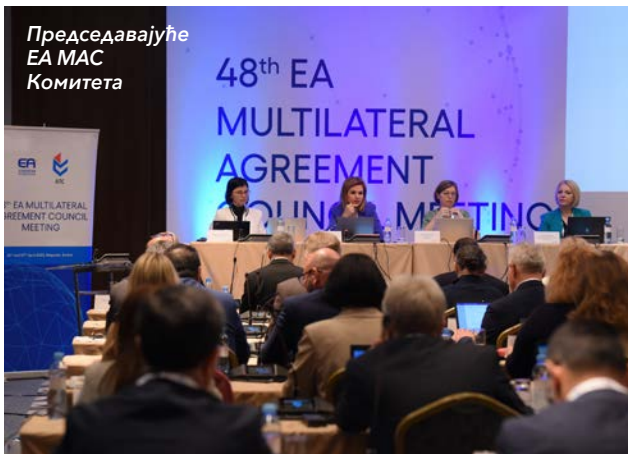
Председавајуће ЕА MAC Комитета

Обука је одржана у Паризу, у периоду од 12. до 14. децембра а домаћин је био ЕА Секретаријат.