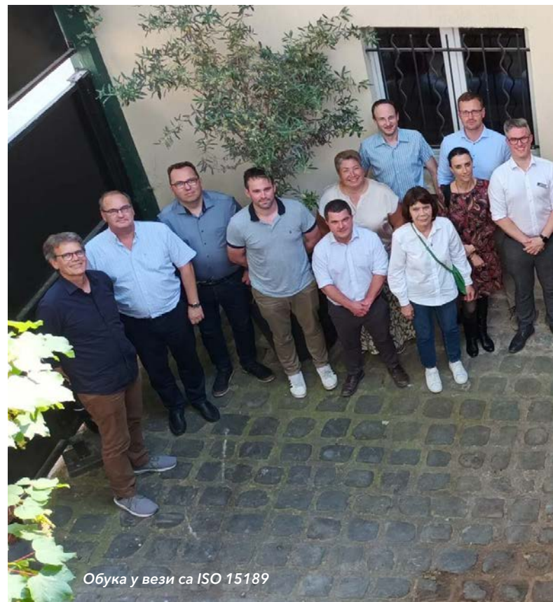
Обука у вези са ISO 15189

Крајем септембра 2023. године уз помоћ TAIEX-а, одржана је обука за акредитацију референтних материјала према стандарду ISO 17034:2016.