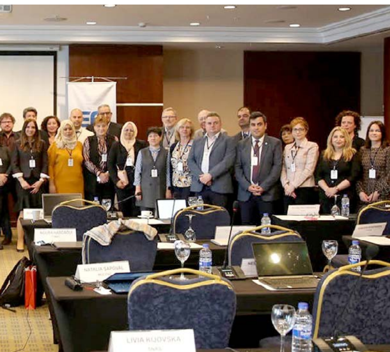
Participants of the 45th EA LC Committee